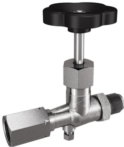
Manometer-nålventil DIN 16270