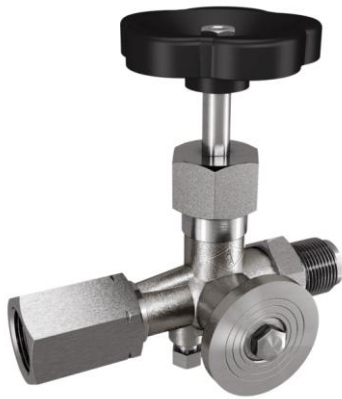
Manometer-nålventil DIN 16271