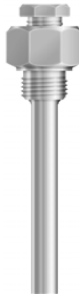
Innstikklengder 50, 60 eller 140 mm